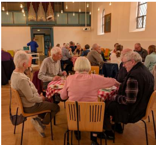
Frokost efter Matadorgudstjenesten