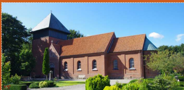
Badskær kirke · Ålborgvej 288 · 9352 Dybvad