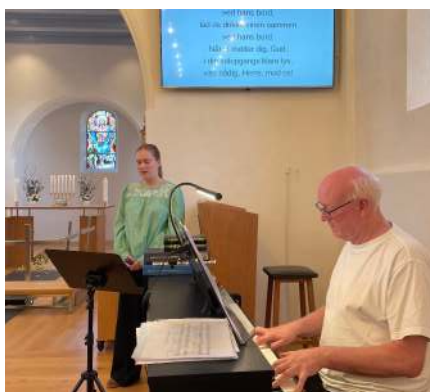
Måltidsgudstjeneste Skærtorsdag med fodvaskning, korsang og spising