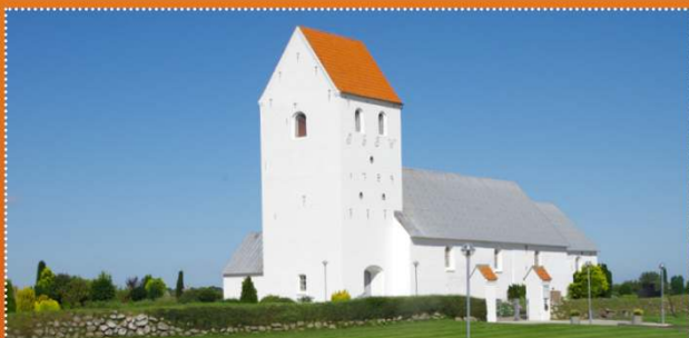
Skæve kirke · Skævevej 68 · 9352 Dybvad