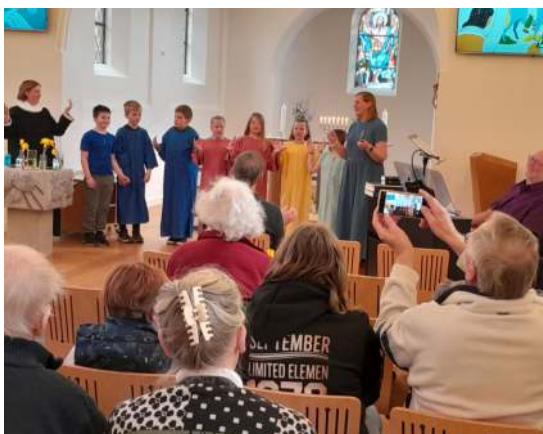
Palmesøndag med Påskespil