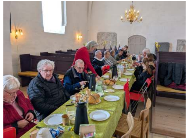
Påskevandring 2. Påskedag mellem Hørby og Torslev Kirker