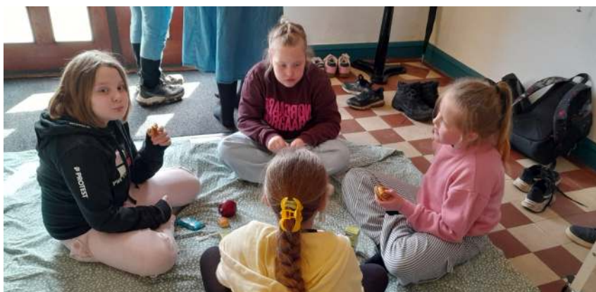
Minikonfirmander på besøg i Badskær Kirke