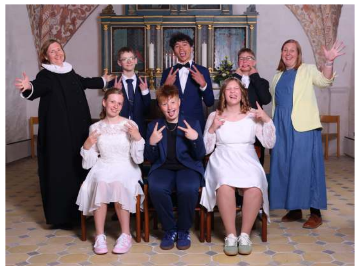
Se lige de skønne konfirmander i Hørby og Skæve Kirker!