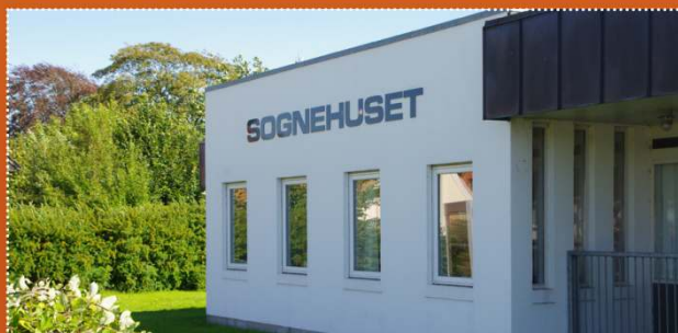
Sognehuset · Hjørringvej 105 · 9300 Sæby