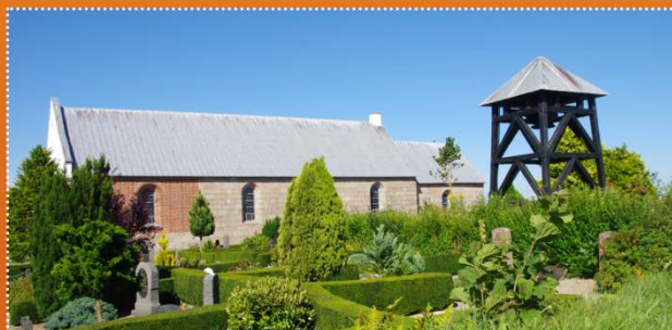
Hørby kirke · Nyholmsvej 3A · 9300 Sæby