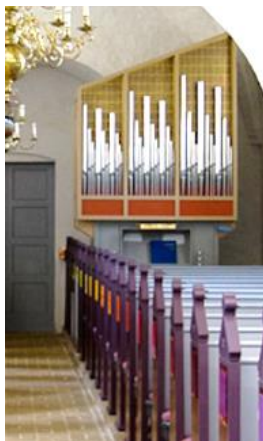
Orglet i Skæve Kirke:

Marcussen Søn 1975 7 stemmer, 1 manual, pedal