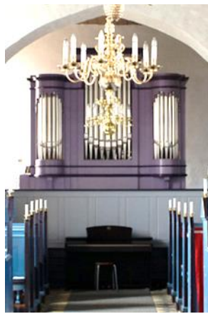
Orglet i Hørby Kirke:

Marcussen Søn 1975 7 stemmer, 1 manual, pedal